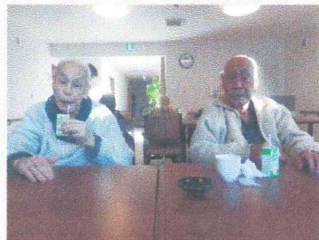
朝食後のひととき